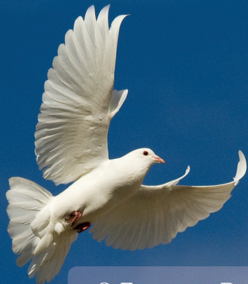
O Fruto e os Dons do Espírito